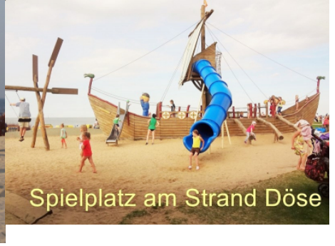
Spielplatz am Strand Döse